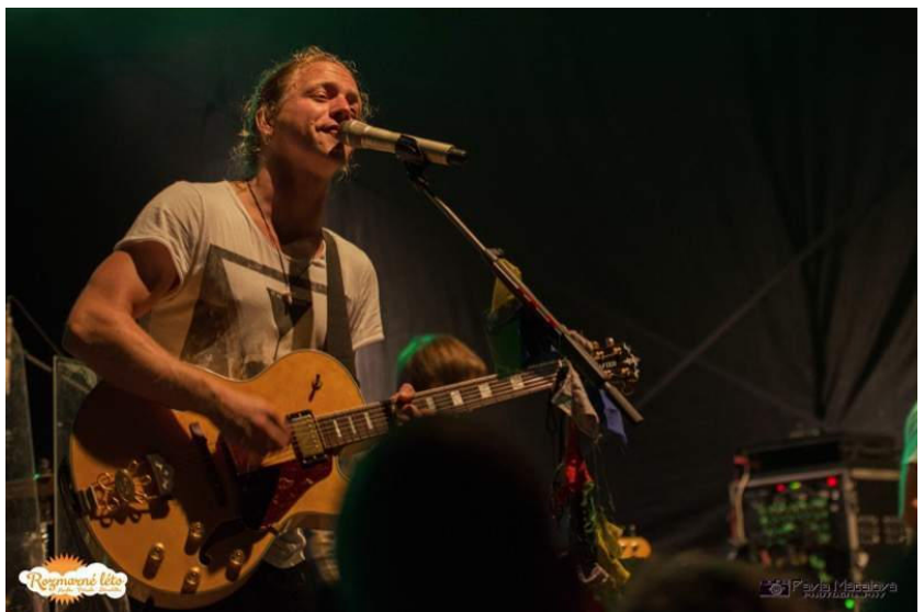
Tomáš Klus - Rozmarné léto