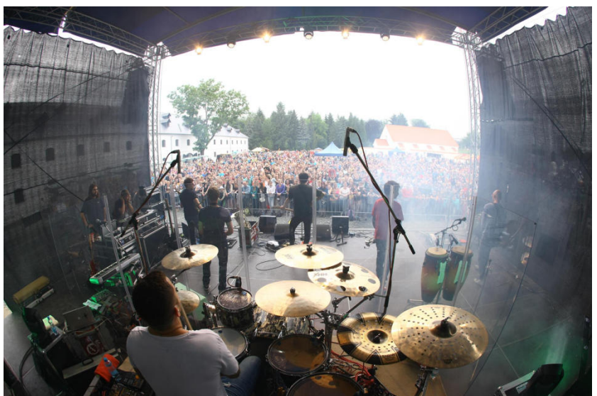
Chinaski - Česká potravina pomáhá