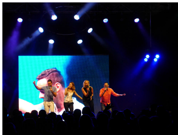
Bounty Rock Café Open Air